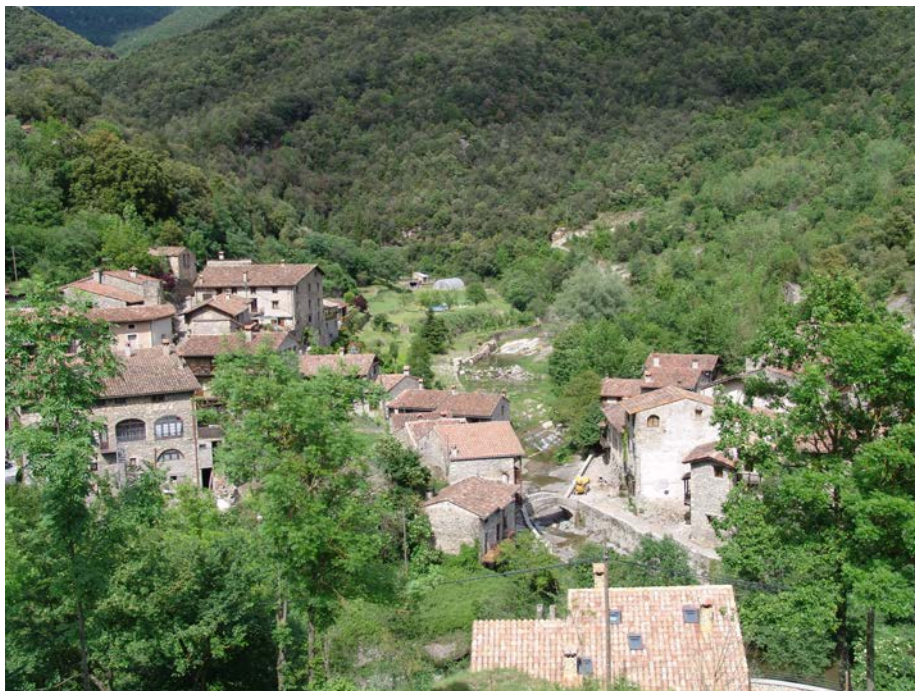
Paisatge de muntanya mitjana