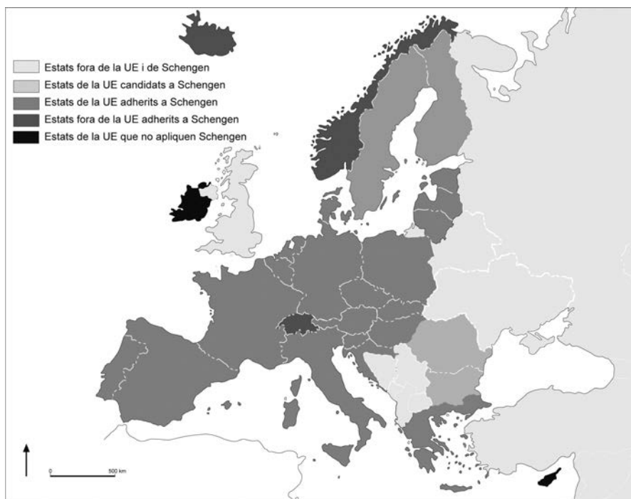
Estats adherits al Tractat de Schengen